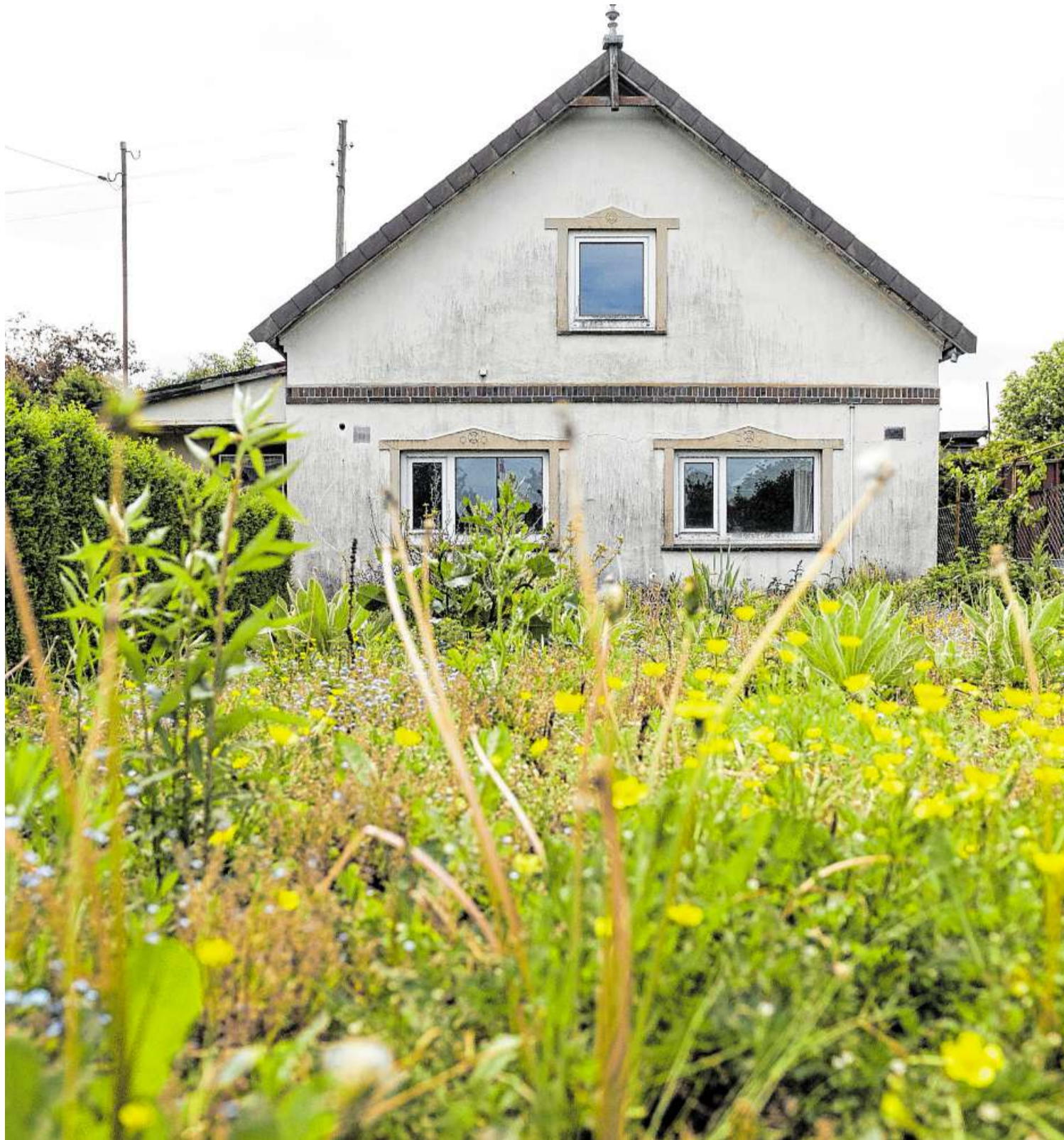
Ein verfallenes Kaisenhaus. Die Kleingärtner sperren sich nicht mehr gegen den SPD-Vorstoß zur Bebauung verwaister Parzellengebiete.